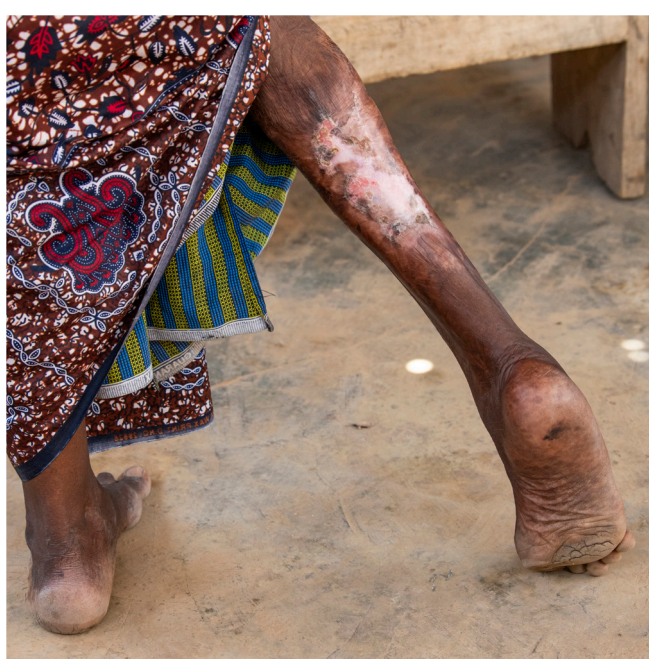
▲ A perna de Amina foi gravemente infectada após um acidente de bicicleta. À esquerda: Amina (extrema esquerda) usa um aparelho de áudio especial para compartilhar a Palavra de Deus com seus vizinhos.

Sete mulheres sentam-se no chão, felizes por estarem juntas. O salmo continua: